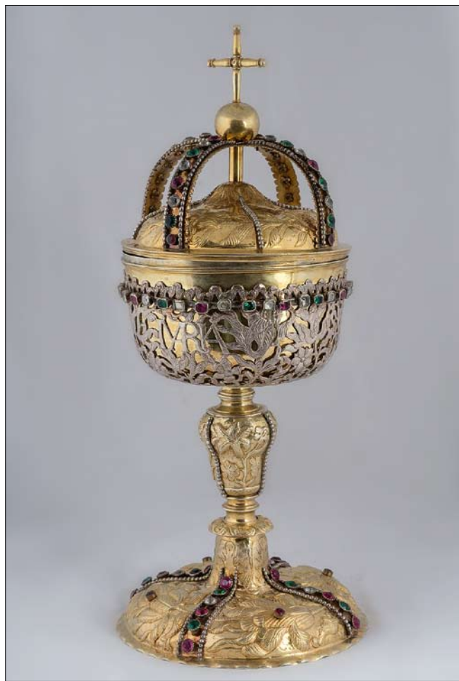
Obr. 8: Ciborium, mistr SV, augšpurská provenience, po polovině 17. století.