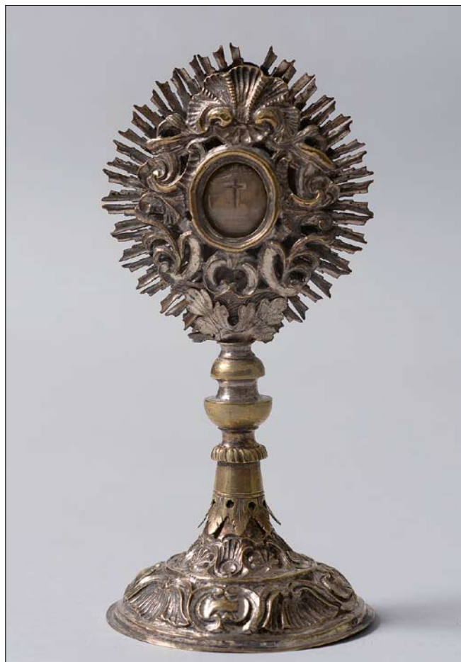
Obr. 22: Postříbřený relikvíř s částčkami roušky Panny Marie a sv. Kříže (Muzeum Vysočiny Jihlava, pobočka Telč, Te-16/A/96).