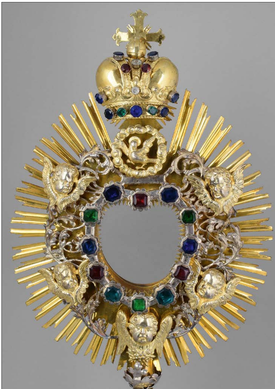
Obr. 12: Monstrance, detail ostensoria.